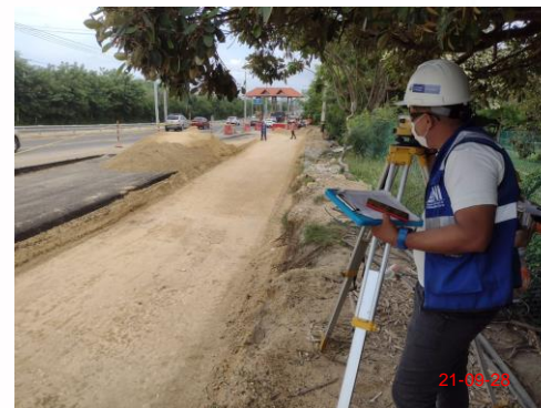
Foto 4. Revisión Cotas sub-base Carril 4 Báscula Papiros K0+305/350.