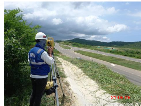
Foto 2. Levantamiento planialtimétrico del ZODME ( Zona de Materiales de Excavación).