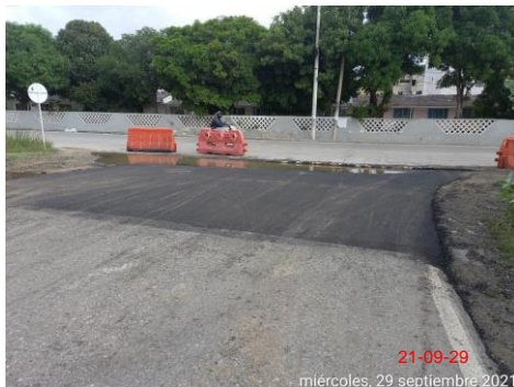
Foto 1. Rehabilitación empalmes Conexión 4 Asfalto 1ra capa K31+350 CD.