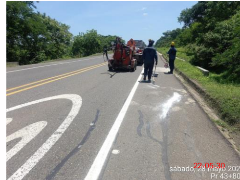
Foto 4. Ruteo, sello y cal en fisuras en asfalto.