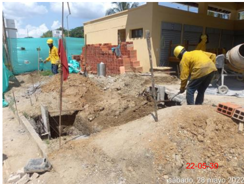
Foto 3. Construcción pedestales y relleno de zapatas área de cubierta pequeña de alimentos.