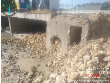
Foto 1. Remoción piedras que obstruyen Canal.