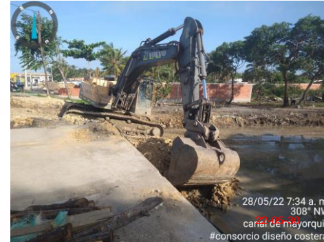
Foto 2. Conformación capa pedraplén.