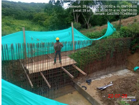
Foto 1. Instalación aceros horizontal muros del parqueadero.