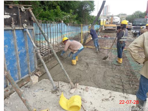
Foto 4. Vaciado placas módulos 06-07.