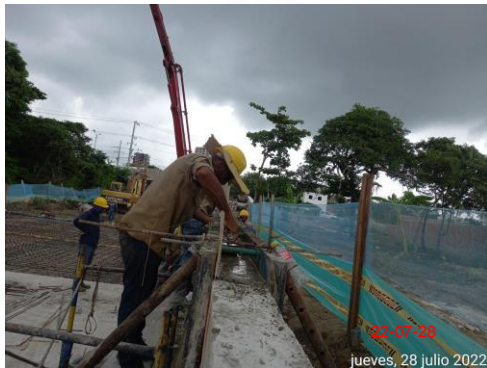
Foto 3. Vaciado muros módulo 08.