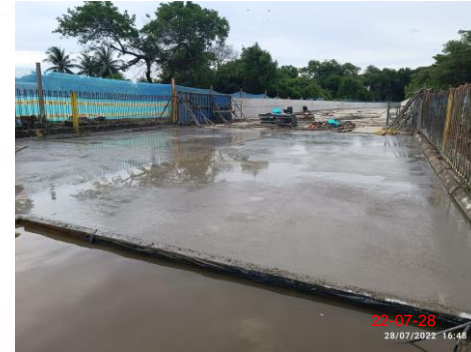
Foto 2. Vaciado placas módulos 06-07.