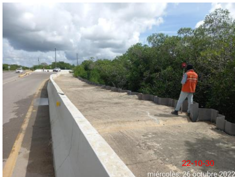
Foto 1. Control topográfico asentamiento carri retorno y tablaestacado viaducto.