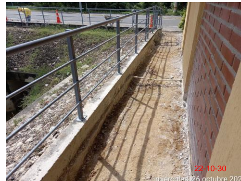
Foto 4. Demolición andén área baños y parqueadero.