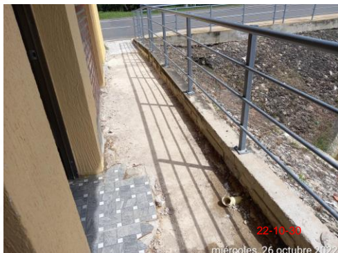
Foto 3. Demolición andén área baños y parqueadero.