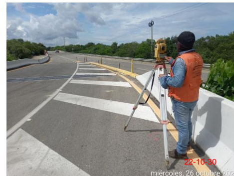
Foto 2. Control topográfico asentamiento carri retorno y tablaestacado viaducto.