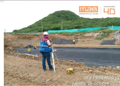
Foto 2. Revisión topográfica niveles tuberías filtro y piedra 3ra terraza.