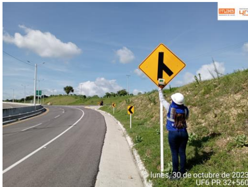
Foto 3. PR32+560 medición de la retroreflectividad de la señalización vertical.