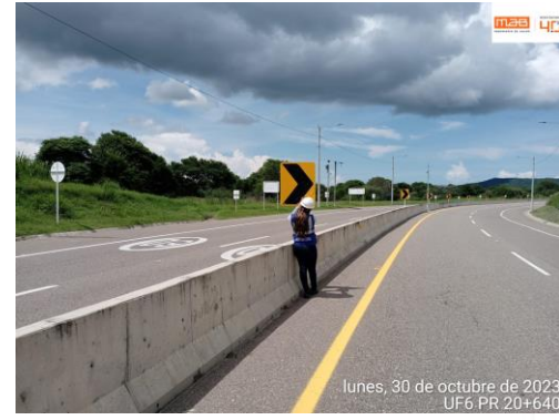
Foto 4. PR20+640 medición de la retroreflectividad de la señalización vertical.