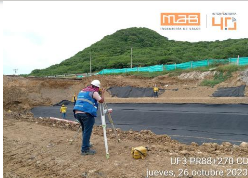
Foto 1. Revisión topográfica niveles tuberías filtro y piedra 3ra terraza.