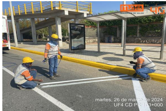
Foto 3. UF4 Calzada derecha PR 103+000 - Repintado de la demarcación de la horizontal.