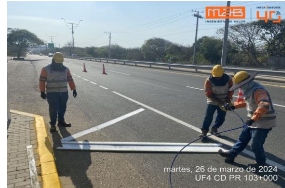
Foto 4. UF4 Calzada derecha PR 103+000 - Repintado de la demarcación de la horizontal.