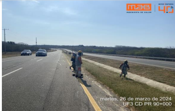
Foto 1. UF3 Separador central PR 90+000 - Limpieza del canal abierto.